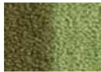
Tilleul 250 4 m