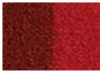
Hibiscus 550 4 m