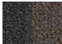
Gris terre 950 4 m