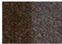
Teck 750 4 m