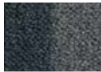
Fumée 940 4 m