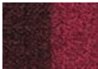
Pivoine 560 4 m