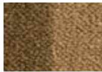
Naturel 620 4 m