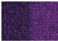
Lilas 860 4 m